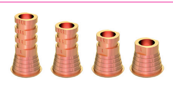
Die neue pink anodisierte Multi-Unit Ti-Base.

Das prominenteste Beispiel für Sofortstabilität ist die All-on-Tri-Lösung. Das All-on-Tri Behandlungsprotokoll ermöglicht eine schnelle und zuverlässige Versorgung von zahnlosen Patienten mit limitiertem Knochenangebot mit lediglich vier Implantaten in Kombination mit geraden und bis zu 30° abgewinkelten verschraubbaren Abutments. Eine hochmoderne Behandlungsmöglichkeit mit erheblichem Mehrwert für Patienten sowie eine höhere Lebensqualität.