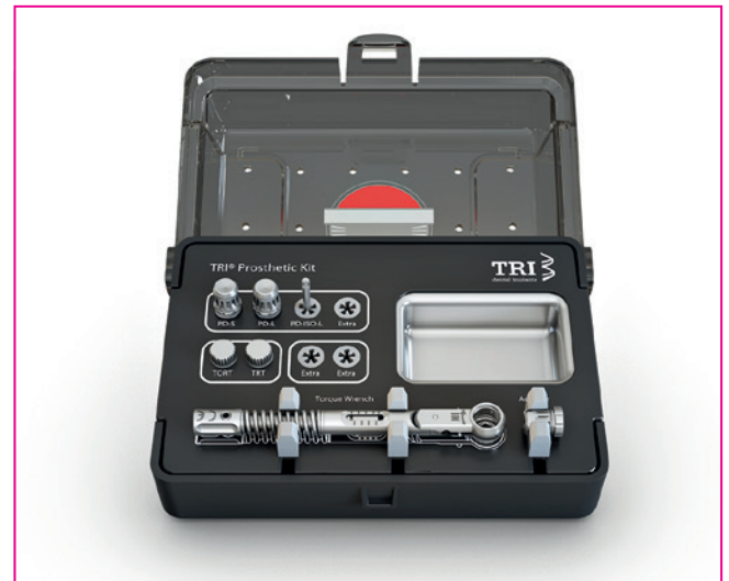
Das neue Prothetik-Kit

Während der Europerio präsentierte Tri eine neue Version seines Prothetik-Kits, welches alle Instrumente für den restaurierenden Zahnarzt zur Handhabung von Einheitskomponenten und zum Einsetzen provisorischer und endgültiger Versorgungen enthält. Das neue Prothetik-Kit verfügt über die gleiche Retentionstechnologie